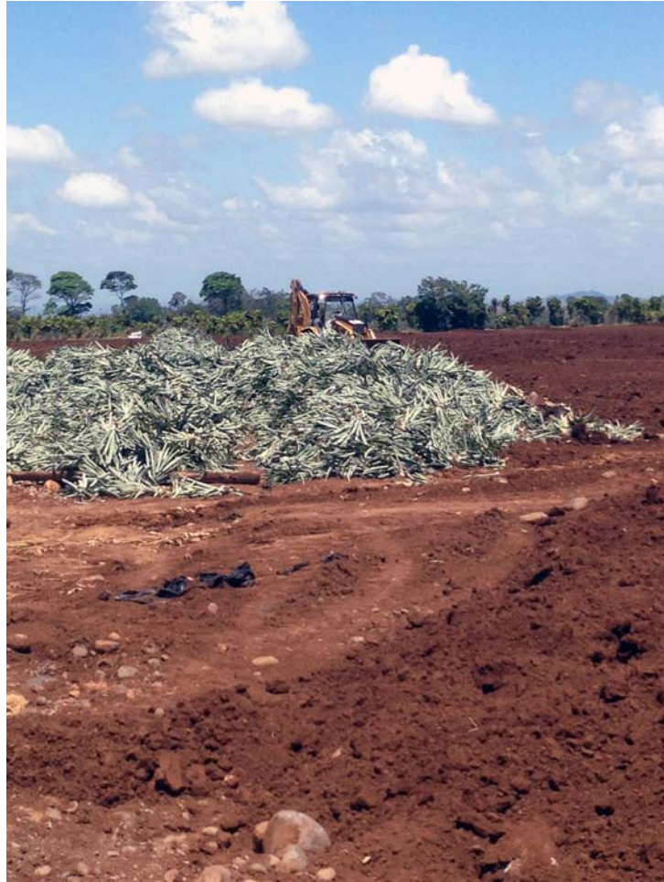
Figura 2. Terrenos preparados para la resiembra del cultivo de piña, cercanos al área de reserva.