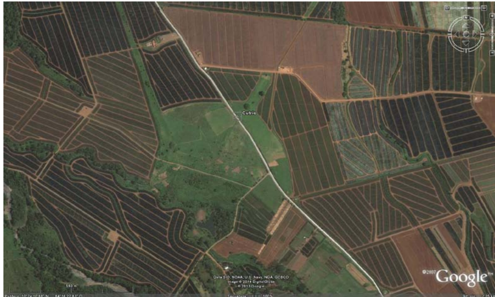
Figura 1. Imagen satelital con la ubicación del monumento arqueológico Cutris (A-21 Ct), con las áreas de reserva.

tamaño pero también importante, pertenece a Frutas Tropicales Venecia SA, la cual tiene al parecer un nuevo dueño Inversiones Santa Fe